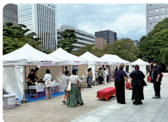
▲オープニング式典の様子