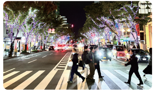
▲ 筑紫口通りの様子

博多駅周辺地区の回遊性向上、防犯対策を目的に、はかた駅前通りや大博通り、筑紫口中央通りなどの街路樹に120万球ものLEDストリングスを装飾してまちを彩る「冬のファンタジー・はかた」を開催しました。街路樹や歩道上の地下鉄出入口などの公共空間を彩ることで、JR博多シティやキャナルシティ博多などの核となるイルミネーションをつなぎ、エリア全体でクリスマスシーズンの街並みを華やかに演出しました。