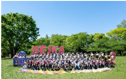
精華女子高等学校吹奏楽部の演奏により、 “どんたく”ストリートのオープニングを飾ります。