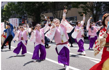
2日目は「ふくこいどんたく隊」による 明るく元気な演技で開幕します。