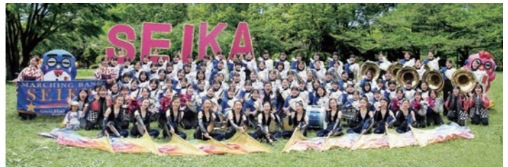
精華女子高等学校吹奏楽部