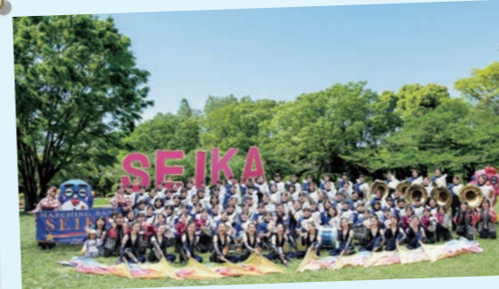
精華女子高等学校吹奏楽部

以来、祝いあう行事をシャレツ気の多い博多町人が発展させたもので、昭和37年(1962年)に「福岡市民の祭り」となり、現在では見物客数が2日間で200万人を超える、全国でも有数の祭りに成長いたしました。