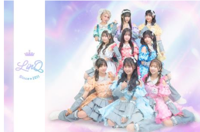
九州発のアイドルグループ「LinQ」が今年も特別参加!! 初日のエンディングを飾ります。