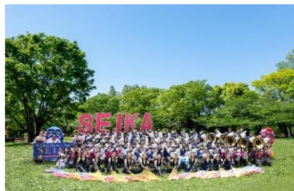
精華女子高等学校吹奏楽部の演奏により、 “どんたく”ストリートのフィナーレを飾ります。

このほかにも 地元企業パレード のほか、ダンスや よさこい、マーチング など華麗で勇壮な 演舞を披露します。