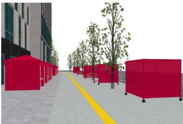
(歩道から見たイメージ)