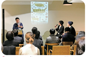
▲ ミートアップトークイベントの様子