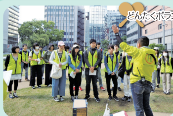
どんたくボランティアの皆さま