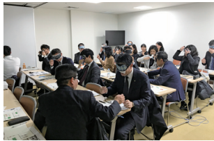
▲ 目隠しジャンケンの様子

「ユニバーサル都市・福岡を目指したバリアフリーのまちづくり」をテーマに、福岡市の出前講座を受講しました。ユニバーサル都市の在り方や障害別のバリア、身近なバリアフリー事例の紹介などをいただきました。実際に目隠しをした状態でジャンケンや、絵の特徴を伝えるなどの体験も行い、障害のある方に対するサポートの仕方について考える良い機会となりました。