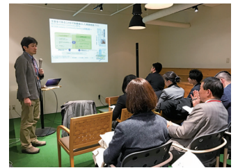
▲ 防災セミナーの様子