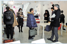
▲富山まちなか研究室視察の様子