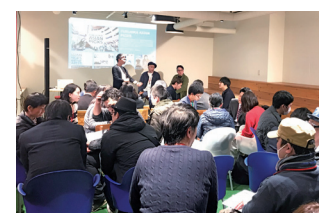
▲ ミートアップトークイベントの様子