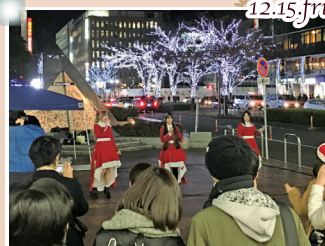
i-rayミニライブと サイリウムダンスパフォーマンス