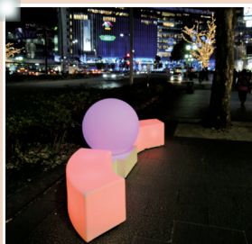
大博通り設置のベンチ&amp;ボール

今年より、回遊性向上に資するイルミネーション期間中の新たな「にぎわいスポット」の新設を目指し、博多駅筑紫口駅前広場および大博通りにおいて、「インスタ映え」する「LED製ライトニングベンチ・ボール」を設置しました。このうち、大博通りについては、「国家戦略道路占用事業」を活用した取組として、公道上の歩行空間を有効活用したにぎわいづくりに取り組みました。