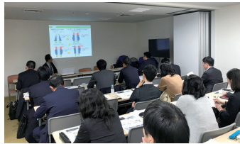
▲ 出前講座聴講の様子