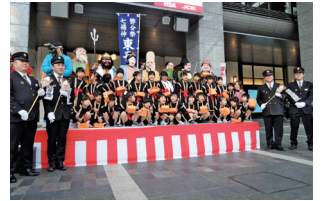
▲博多駅前広場表敬訪問の様子