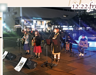
博多フォーク同好会ミニライブ

さらに、イルミネーション期間中のにぎわい創出を目指し、(学)Adachi学園九州ビジュアルアーツの皆さんによる「博多イルミ劇場」を博多駅筑紫口駅前広場で開催しました。