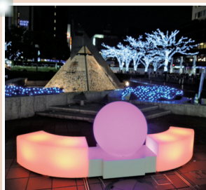
筑紫口設置のベンチ&amp;ボール