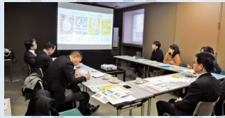
▲まちづくり福井(株)様との意見交換の様子

2018年(平成30年)度は当協議会10周年という節目の年を迎えます。更なる協議会の発展を目指して、この視察で得たものを生かしていきたいと考えています。