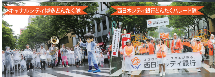
キャラシティ博多どんたく隊