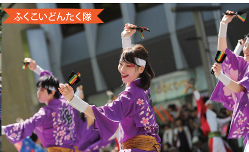
ふくこいどんたく隊