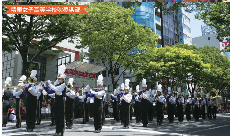
精華女子高等学校吹奏楽部