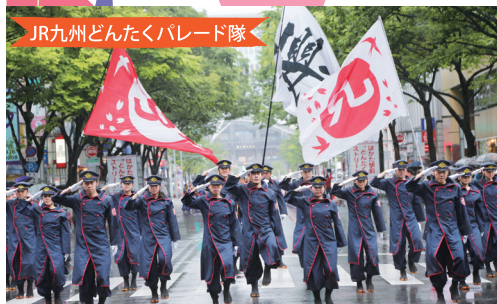
JR九州どんたくパレード隊