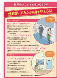
性犯罪防止啓発リーフレット▶