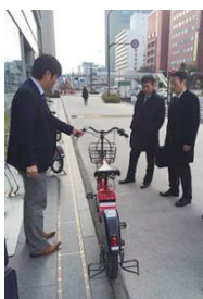
▲コミュニティサイクル試乗の様子