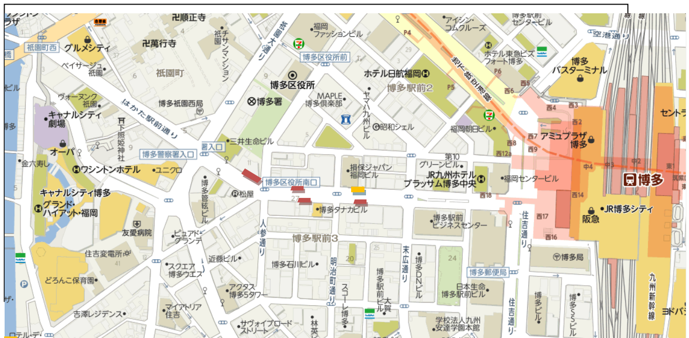
「はかた駅前マルシェ」実施箇所（11/14, 15, 21, 22）