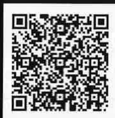
スマートフォンの方