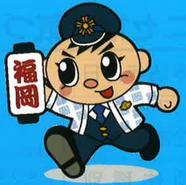
福岡県警察シンボルマスコット 「ふっけい君」