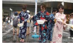
▲博多駅前広場の風景

8 月 5 日 (金)、博多の夏の風物詩「博多ひ～んやり! 打ち水」を実施しました。今年は中洲町連合会さまと連携し、博多地区 32 箇所、中洲地区 7 箇所の合計 39 箇所で開催しました。当日は浴衣姿の参加者も数多く見られ、また博多駅前広場やキャナルシティ博多には「氷柱」を飾ることで涼しさの演出も行い、約 750 名の参加者で大変にぎわいました。また参加の皆様には飲食店等で使える「特典クーポン付冷却パック」をノベルティとして配布し、PR 活動を行いました。