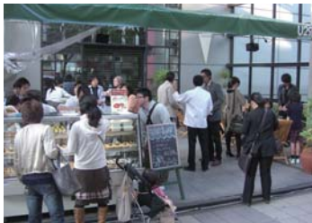
▲はかた駅前通りオープンカフェの様子

JR 博多シティからキャナルシティ博多につながる、はかた駅通りの中ほど損保ジャパン福岡ビル前で 2 日間限定のオープンカフェ「U29 Café+」ユニークカフェプラスを開催しました。九州観光専門学校のカフェ&スイーツ学科の協力のもと、カレーやサンドイッチの軽食やスイーツ&