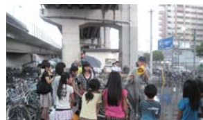
▲自転車マナーアップ教室の様子

8 月 23 日 (火)、博多区役所さまのご協力のもと、小学生を対象とした「自転車マナーアップ教室」を開催しました。当日は 12 名の皆様にご参加いただき、放置自転車の現状、走行マナーについての講義の後、実際に違法駐輪自転車を撤去する作業、また撤去された自転車が保管される榎田保管所の見学も行いました。参加した小学生は、撤去されていく自転車を目の当たりにし、これからもより一層マナー向上に努めようとする真摯なまなざしでした。