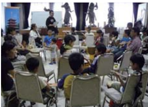
▲手作りギターでセッションを楽しみました!

8/20 (土) 東長寺 2 階ホールにて、ワクワクワークショップ～手作りギターを作ろう～をヤマハさまご協力のもと午前と午後の 2 回開催いたしました。当日は午前の部と午後の部を合わせて 23 組計 60 名の方にご参加いただき、親子でダンボール製のギターキットを切り取りギターを製作した後、ドラムサークルの先生の主導のもと、参加者全員で手作りギターとパーカッションでセッションをいたしました。保護者の方もお子様も楽しめたワークショップとなりました。