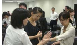
▲熱心に学びました!

博多警察署さまのご協力のもと、6 月 30 日 (木) に「第 2 回防犯対策講習会」を開催しました。生活安全課の皆様を講師としてお招きし、福岡県下の犯罪に関する講義の他、犯罪に遭わないための基本知識、簡単な護身術を学びました。当日は協議会会員の女性を中心とし、123 名の方にご参加いただきました。