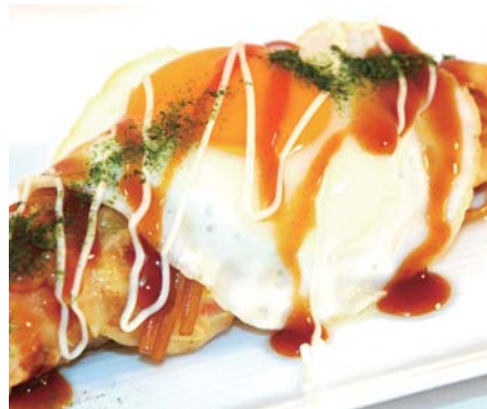
▲新しいB級グルメ「よこまき。」

発足からまだ浅いYokotterですが、市民の小さな吹きに応えるのはもちろん、市役所や観光協会とも連携して事業を進めており、ある市民のツイートから公園の柵の修理にまで至った例や、あるツイートをヒントに、横手やきそばと箸巻きをミックスしたような新しいB級グルメ「よこまき。」を開発・販売し、名物グルメとYokotterの一部財源の創出に至った例もあります。