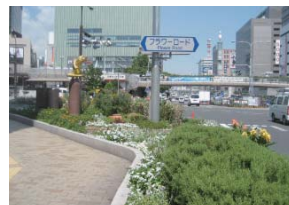
神戸市：税関線沿道都市景観形成地域(フラワーロード)

今回、福岡市都市景観室からのお声かけもあり、行政の方々とともに神戸、横浜、銀座などの駅周辺の街並みを視察してきました。いずれの地区も法律や条例などに基づいて、建築物や広告に一定の規制がされており、都市景観に配慮しています。街並みの景観づくりには、その街の歴史や通りの特性を踏まえた将来像を描くことが重要であり、また、その実現には、行政と地域が一体となった取り組みが欠かすことができないことが分かりました。