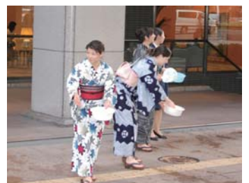
ホテル日航前での打ち水風景。