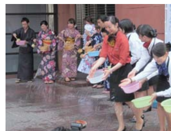
西日本シティ銀行本店前での打ち水風景。

8/20(金)、博多駅周辺の22箇所では18:15から一斉に打ち水を実施しました。会員さまの敷地内へのぼり旗やバケツを置かせていただき、そのご協力があったて実施できました。また、これだけの場所で一斉に実施するのは初めてで、スケール感あるものになりましたし、浴衣や甚平を着た方も参加していただくことで、よりにぎわいが出ました。打ち水によって、吹き抜ける風がより涼しく感じ、多くの参加者はとても喜んでいました。