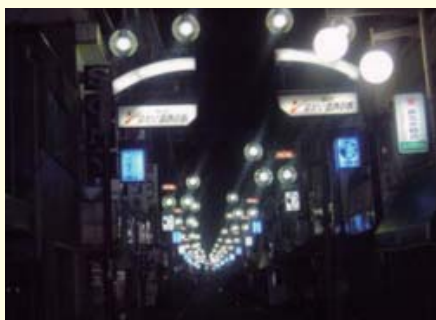
▲ 青色防犯灯が点灯されている様子

青色防犯灯は、電球を替えるだけでよく、導入コストが割安で維持管理もしやすい特徴があります。青色防犯灯は遠くまで見える割に暗いというマイナス面があるため、全てを青色にするのではなく白色と青色を交互に配置するという独自の工夫を行っています。既存の街路灯 36 本のうち、半分の 18 本を青色に交換するだけで済んだため、導入に要した費用は 15 万円です。維持費・電気代として年間 100 万円かかりますが、青色防犯灯のカバーに商店の広告を載せることで約 65 万円の広告料収入を得ており、不足する 35 万円を商店街会費で補っています。まさに、受益に応じた費用負担のルール化がなされています。