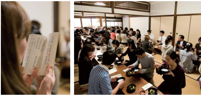
6月に東林寺での読経・朝粥風景。

7月は櫛田神社でのお茶会と、博多町家ふるさと館での博多人形絵付け体験、寺町ウォーキングを実施しました。こちらは22名の方が参加し、宮司さんから神社と山笠の講話を聴いた後、普段は一般の人が入ることの出来ない行幸殿でお茶の作法を習いながらお手前をいただきました。その後は、博多人形絵付け体験と寺町ウォーキングに分かれて、それぞれの体験を楽しんでいただきました。