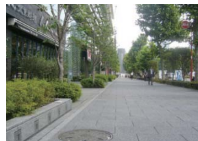
東京都：大手町・丸の内・有楽町地区