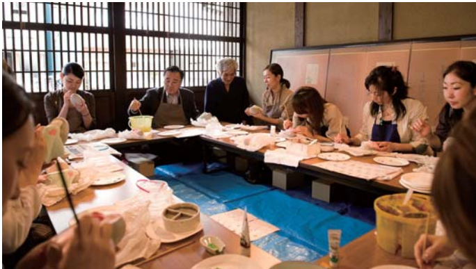
7月の博多町家ふるさと館で博多人形の絵付け体験風景。