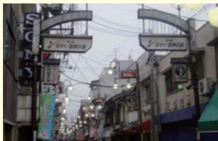
▲ 青色防犯灯が点灯する前

ある年の役員会の会合で「防犯」「安全・安心のまち」が話題になり、自転車や店の商品が盗まれるといった報告がされ、町会や警察の防犯活動とは別に、商店街が独自に取り組みできるものはないかとの話になりました。様々な協議の結果、犯罪抑止効果があるとされる青色防犯灯の設置が決まりました。