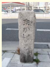
▲ 商店街の近くにある石塔。

大阪市旭区にある「森小路京かい道商店街」は、豊臣秀吉の時代から「京街道」と呼ばれる大阪京都を結ぶ歴史と伝統ある街道沿いに位置する商店街です。40店舗程の規模ですが、近くには「主婦の店ダイエー」の創業の地である千林商店街もあり、昔ながらの大阪を連想させる庶民の台所として、地元で親しまれ活気があります。