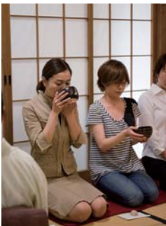
7月に櫛田神社の行幸殿で行われたお茶の作法を習う風景。

この企画は「はかたんOLクラブ」のメンバーが中心となって、寺社との交渉から当日の段取り、情報誌「ラーラぽど」への体験レポート掲載原稿の監修や確認取りまでの一連の作業を行っています。この企画調整作業が大変なのですが、その過程で見聞きできることや、人の繋がりができることは、結果として実施される体験イベント以上に有意義なものではないかと思えます。