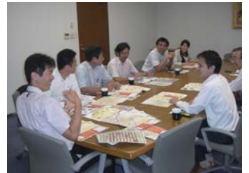
博多まち歩きマップワークショップの様子。

回遊部会では、昨年度「はかたんウォーク」で作成した「博多まち歩きマップ」の本年度版を作成中です。昨年度は秋だけの配布でしたが、本年度は春に九州新幹線全線開業もあることから、秋から春にかけて、全部で30万部作成する予定です。内容も充実を図り、「山笠満喫