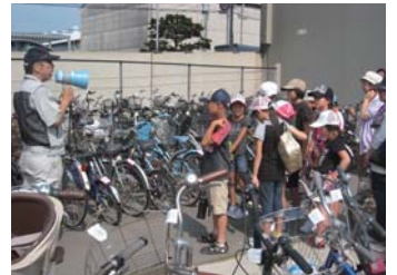
子供たちと榎田保管所を見学する様子。

8/20(金)、小学校4～6年生を対象に、約20名の方に参加していただき、マナーアップ講義や自転車が撤去される様子、撤去された自転車が保管される榎田保管所を見学するツアーを実施しました。九州新幹線全線開業に伴い、違法駐輪のない