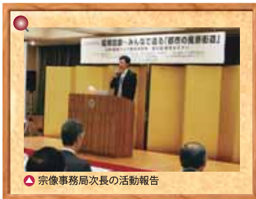
宗像事務局次長の活動報告

協議会からは宗像事務局次長が、協議会の設立経緯を振り返った後、様々な活動や天神地区をはじめ他地区との連携により、都市間競争の中で福岡が選ばれる都市となるよう、魅力の磨き上げと発信に取り組みたい旨の報告を行いました。