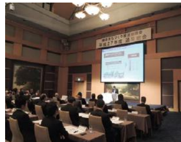
平成27年度通常総会