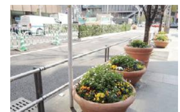
はかた駅前通りの植栽

はかた駅前通りの約600mにわたり、沿道の植栽帯の一部を管理し、来街者や地域住民の目を楽しませた。