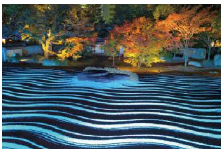
博多ライトアップウォーク2015