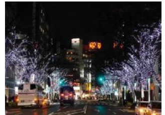
はかた駅前通りのイルミネーション

周辺の回遊性の向上を目的に、SNS「Instagram(インスタグラム)」と朝日新聞の紙面広告を連動させた「博多イルミ新聞」を実施したほか、We Love 天神協議会と連携し、博多・天神で開催されたクリスマスマーケットおよび福岡都心部のイルミネーションを一体的に紹介するタブロイド紙を72万部発行した。