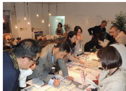
博多を学ばナイトⅢ