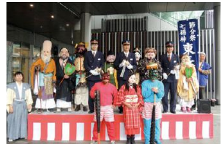
東長寺節分祭表敬訪問