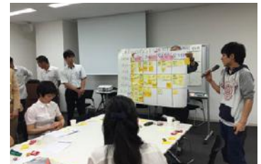
ワークショップ(水害編)の様子

自治協議会と事業者が、避難行動や課題等についての課題共有を図るため、東住吉地区をモデルケースに大規模地震発生直後の3時間に絞り「避難」をテーマにしたDIG(図上訓練)を行った。参加者28名。