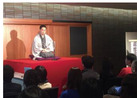
デキる大人の落語入門講座