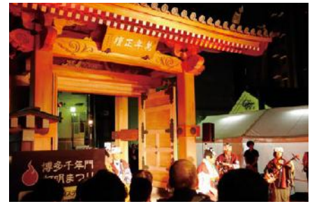
博多灯明ウォッチング2015