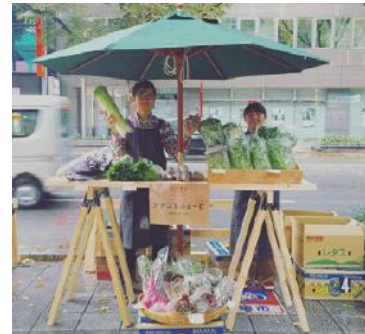
はかた駅前マルシェ