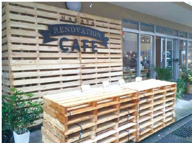
ハカタリノベーションカフェの外観