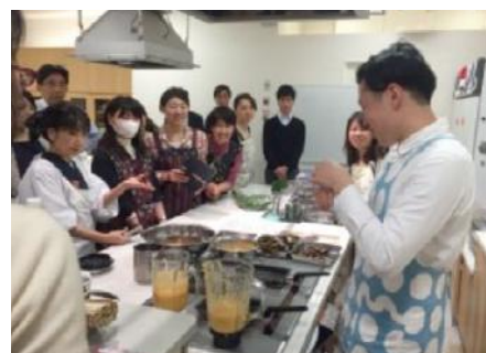
デキる大人の料理講座