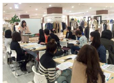
ファッションコーディネート体験講座