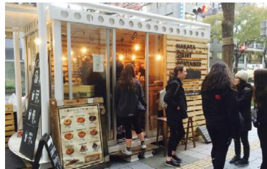
ハカタストリートコンテナ

博多区役所南口交差点付近～博多駅前2丁目交差点付近の歩道上9カ所(駅前2丁目、3丁目)において、週末限定で採れたての野菜や福岡各地の食を集めたマルシェを開催。各日9店舗が出店し、興味を持って足をとめる人が多く、通りでのマルシェの開催について関心の高さがうかがわれた。