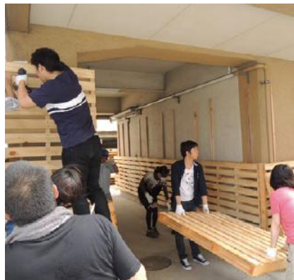
はかた大学「DIY講座」の様子

空室の機能更新手法の周知とそれによるまちのにぎわいの広がりを目指して、ビルの空室をリノベーションにより改修し、1ヶ月限定でカフェを展開した。リノベーションにあたっては、その手法をより身近なものと感じられるように、安価な流通用木製パレットを再利用したほか、はかた大学の学生による「DIY講座」でカフェ空間を作り上げた。また、期間中は会員の皆さまのご協力を得ながら、まちづくりやリノベーションに関する講演会、セミナーなどを日替わりで計34回開催するなど、前年度の取り組みから更なる充実を図った。その他、当協議会の部会・プロジェクトなどの各種会議を開催したほか、活動内容についてもデジタルサイネージ等で情報発信を行い、「まちづくりの拠点」としての機能も合わせて持つカフェとなった。来場者延べ3,139名