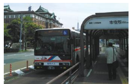
名古屋市視察(基幹バス)