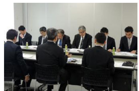
小田急電鉄(株)視察受け入れ